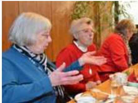
Etwas für sich tun Etwas mit anderen tun

Unser Ziel ist es, Menschen zusammenzubringen, Gemeinschaft zu fördern, gemeinsame Aktivitäten anzuregen und ein Netzwerk lebendiger Nachbarschaft weiter aufbauen.